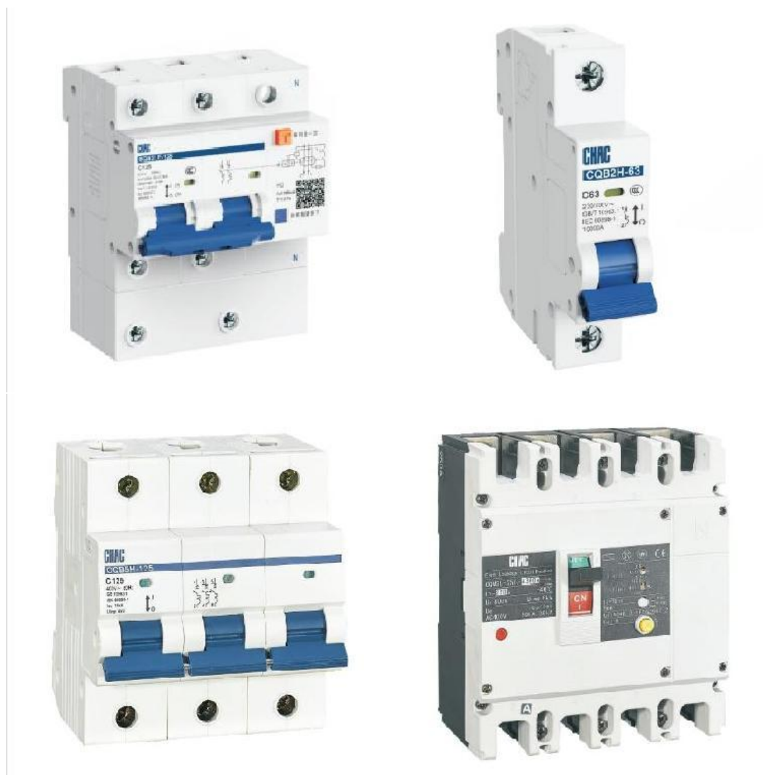
图 1 主要产品

浙江创奇电气股份有限公司的主要产品为工业电器产品中低压终端配电产品，即交流接触器、A型漏电保护断路器、DZ47-63断路器和DZ47B-100断路器，主要的生产加工包括注塑加工、冲压加工、装配加工和模具制造。